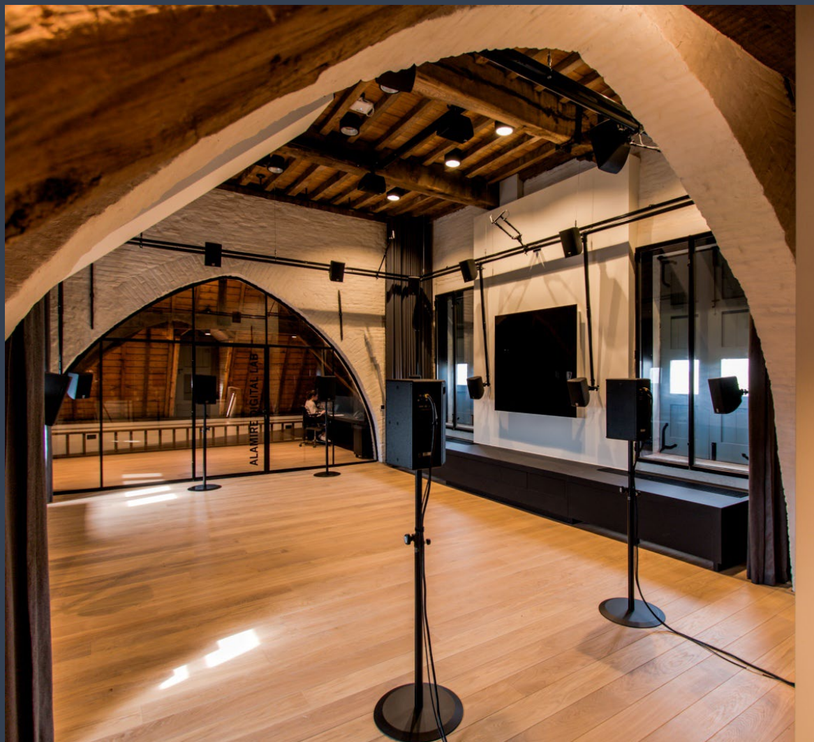
Alamire Sound Lab