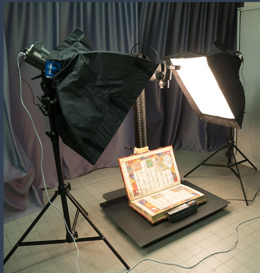
Alamire Digital Lab