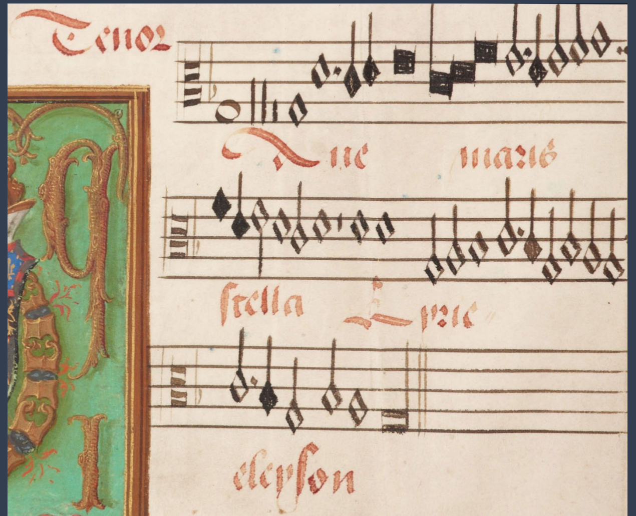
Josquin des Prez Missa Ave Maris Stella